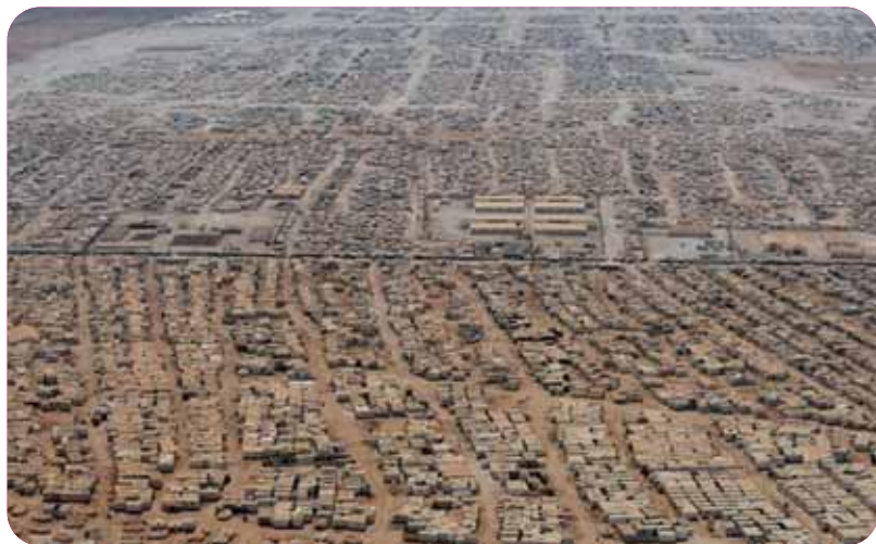
Campo de refugiados de Zaatari (Jordania). Es el segundo más poblado del mundo, solo superado por el de Dabab, en Kenia.

Más de 50 millones de personas, entre refugiados y desplazados internos, viven lejos de sus hogares. Se trata de la cifra más alta que ACNUR, el Alto Comisionado de Naciones Unidas para los Refugiados, ha registrado desde la Segunda Guerra Mundial. Es un drama que no cesa y que, lejos de solucionarse, sigue creciendo alimentado por conflictos armados como los de Siria, Israel-Palestina, República Centroafricana, Afganistán o Sudán del Sur.